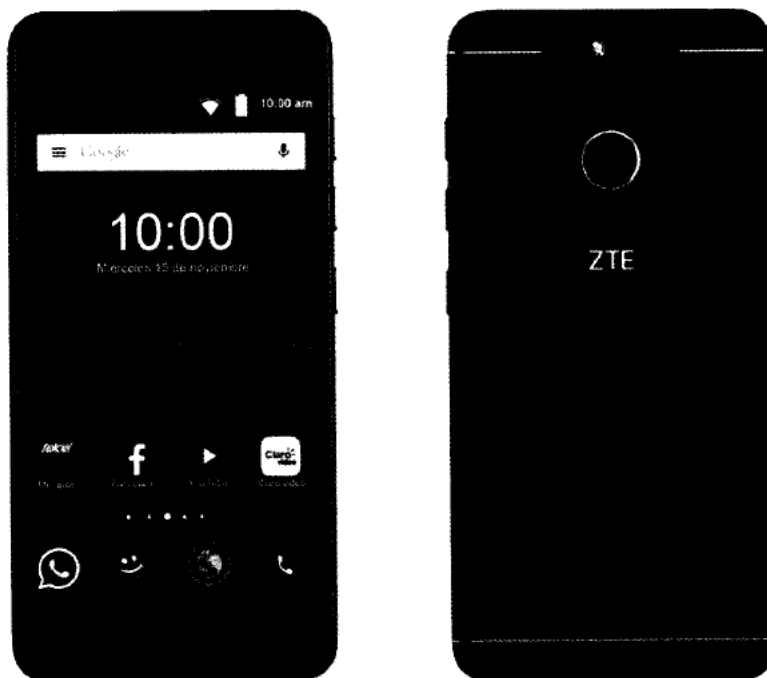
ZTE V8Q 4G LTE Blade