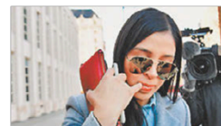
Alegatos finales en EU Sin duda, El Chapo es líder del cártel de Sinaloa: fiscalía

Al preguntarle si se acabó la guerra contra el narcotráfico, respondió: "Sí, ya no hay guerra, oficialmente ya no hay guerra. Nosotros queremos la paz y vamos a conseguirla". Abundó en que la indicación que tienen todas las áreas del gobierno involucradas en la lucha contra la inseguridad y la violencia es atender los delitos que más afectan a los ciudadanos, más que la pelea entre las bandas del crimen organizado. PÁG. 14