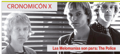
Las Melomanías son para: The Police