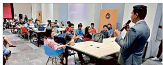
En septiembre, el Cuartel Creativo en el edificio Aróniz fue sede de un hackatón que retó a jóvenes a crear videojuegos.