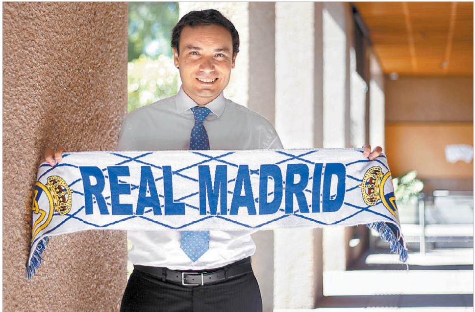
El panista también es aficionado del Real Madrid. ARACELI LÓPEZ

Creo que por el tiempo, porque las próximas elecciones son hasta 2024, seguramente veremos primero al Cruz Azul como campeón, pero estoy seguro de que en la primera oportunidad que tenga el PAN para regresar a la Presidencia, regresaremos, estoy seguro.