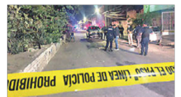
Menor se ahoga en Colomos Mueren nueve personas en hechos violentos en el AMG