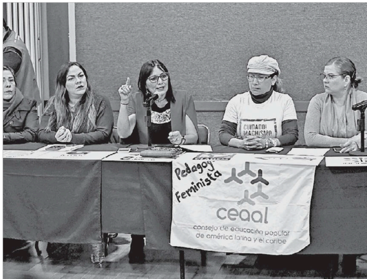
Más de 20 agrupaciones participaron en la rueda de prensa. FERNANDO CARRANZA

"Se descuidaron las formas más elementales de la escucha y del cumplimiento que manda la Ley Orgánica del Poder Legislativo", dijo al señalar que Alfaro Ramírez sí la consultó sobre la