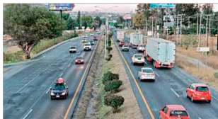
Una de las obras propuestas sería la ampliación a tres carriles de un tramo de López Mateos Sur.

Aunque descartó detallar las diferentes obras que contemplan debido a que la propuesta continúa en análisis, se expone la ampliación a tres carriles de López Ma-