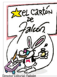
Director Editorial: Falcón