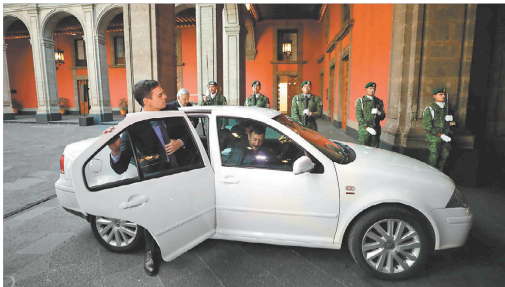
Luego del recorrido por Palacio, AMLO le dio un aventón al español Pedro Sánchez con rumbo al Colegio de San Ildefonso. ESPECIAL